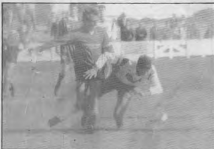
La moral y las posibilidades están tiradas por los suelos, pero aún se pueden levantar.

Al mister alcalaño le queda faena por delante. No sabe ya si es problema físico o psicológico. "Los dos pueden influir -dijo- ya que si tu no corres más que el contrario al final pierdes y en lo otro si no salen mentalizado que debes salir como ellos pues te puedes equivocar". Y es que el Alcalá parece que volvió a jugar con suficiencia, algo que él explica: "nosotros no nos podemos