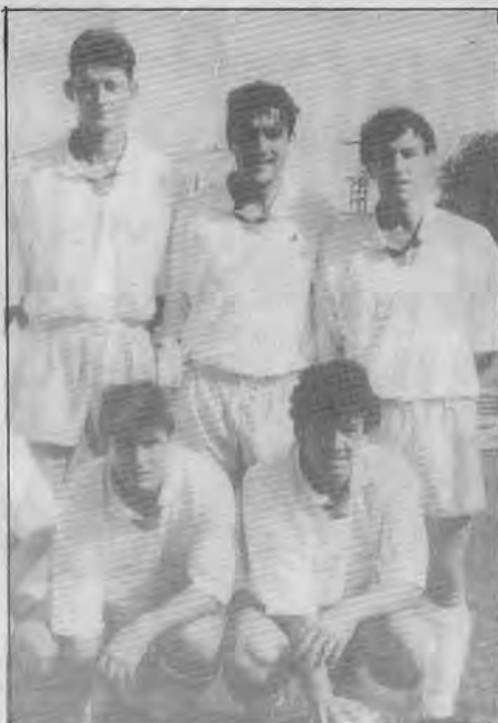
Los alcalaños no encuentran el rumbo que ya han perdido.

uno. Y además hubo un gol anulado. La segunda parte fue distinta. El Alcalá no existió. Los cambios no surtieron efecto y gracias al árbitro el Alcalá no cayó derrotado.